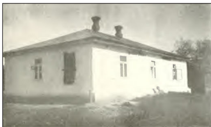
Домик управляющего сельскохозяйственной фермы