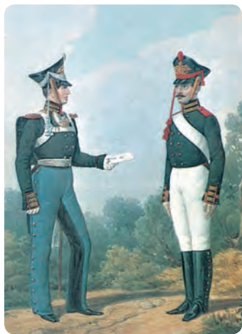
Обер-офицер и бомбардир гвардейской пешей артиллерии. Раскрашенная литография Бека по рисунку Губарева. Середина XIX в.