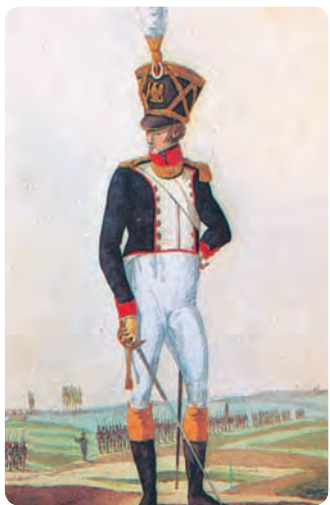
Форма наполеоновской армии. Офицер линейной пехоты. Раскрашенная гравюра Мартине. 1810-е гг.