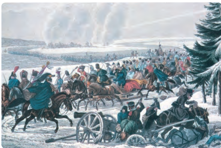
У Березины 26 ноября 1812 г. Раскрашенная гравюра неизвестного художника. 1-я четверть XIX в.

о готовящейся там переправе. Этим приемом ему удалось свернуть к югу от дороги на Борисов толпы безоружных, устремившихся к месту ожидаемой переправы. Сам же Наполеон с организованными войсками повернул от Борисова к северу и с утра 14 (26) ноября приступил к оборудованию переправы у деревни Студянка (два моста на козловых опорах) 29 . Чичагов был обманут демонстрацией французов и двинулся в район южнее Борисова, не оставив к северу от него сколь-либо значительных сил. Адмирал при этом не выполнил прямого и совершенно ясного приказа Кутузова, потребовавшего от него прочно занять весьма выгодное для обороны лесное дефиле у Зембина 30 . В последнем пункте Чичагов не оставил вообще никаких сил, а западный берег Березины у Студянки оборонялся только четырьмя недоукомплектованными батальонами, которые, конечно, не могли воспрепятствовать переправе французов. Левофланговая дивизия Чичагова, подоспевшая в середине дня 14 (26) ноября к району переправы, уже не смогла отбросить переправившиеся первые эшелоны французских войск.