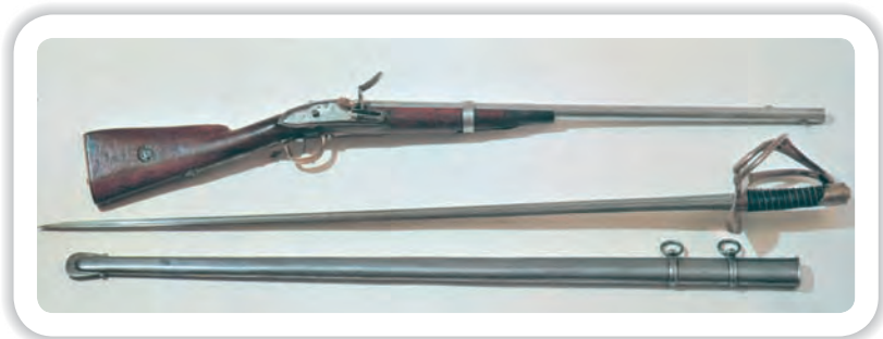
Образцы оружия Тульского оружейного завода. Начало XIX в.

И все же Бородинская битва явилась, по существу, больше победой, чем поражением русской армии, руководимой Кутузовым. Тактический успех был на стороне русской армии, что впоследствии признавал и сам Наполеон. Атаки французов были отражены, они понесли большие потери и к ночи очистили захваченные ими участки русской позиции. В стратегическом отношении результаты Бородинской битвы явились успехом Кутузова огромного значения. Он достиг выполнения основной задачи, которую ставил перед собой и армией, принимая решение на сражение, — нанес противнику тяжелые потери, восстановить которые Бонапарт в сложившейся обстановке уже не мог, особенно трудно было восстановить потери в коннице 17 . Резервы Наполеона, двигавшиеся на соединение с главными силами (13 тыс. человек), не могли ни в какой мере компенсировать убыль французской армии в Бородинском сражении. Потери же русской армии, также весьма значительные, Кутузов рассчитывал восстановить за счет создания резервов, на что имел вполне реальные шансы.