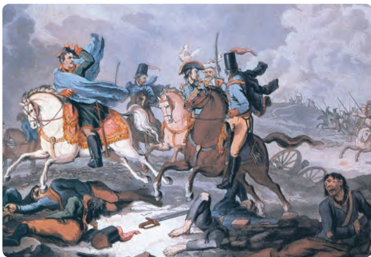
Паническое бегство Наполеона после битвы под Красным.

Одной из основных особенностей полководческого искусства Кутузова являлось то, что он рассматривал тактические действия в непосредственной связи со стратегическими целями, подчинял тактику интересам стратегии. Наиболее важной чертой тактики русской армии в Отечественной войне 1812 года являлся ее активный характер. Будь то наступление или оборо-