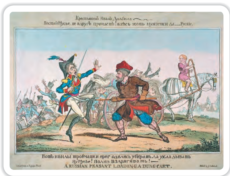
Война русского народа против французов. Английская карикатура. 1813 г.

ступлению. В это же время у него окончательно сложился и стратегический план контрнаступления. Первые приказания исполнителям в соответствии с намеченным замыслом были отданы им еще в момент прибытия в Красную Пахру 6 (18) сентября.