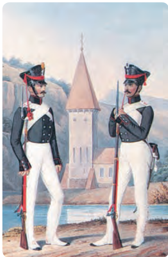
Сапер и пионер 2-го пионерского полка. Раскрашенная литография неизвестного художника. Середина XIX в.

лось подтянуть из тыла лишь 20–25 тыс. человек и поставить в строй 10–15 тыс. человек выздоровевших раненых. В результате Наполеон к моменту возобновления активных действий имел в строю 107 тыс. человек, то есть повысил их численность после Бородинского сражения на 20 тыс. человек.