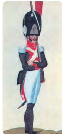
Гренадер итальянской пешей гвардии. Раскрашенная гравюра Ц. Вейланда. 1812 г.