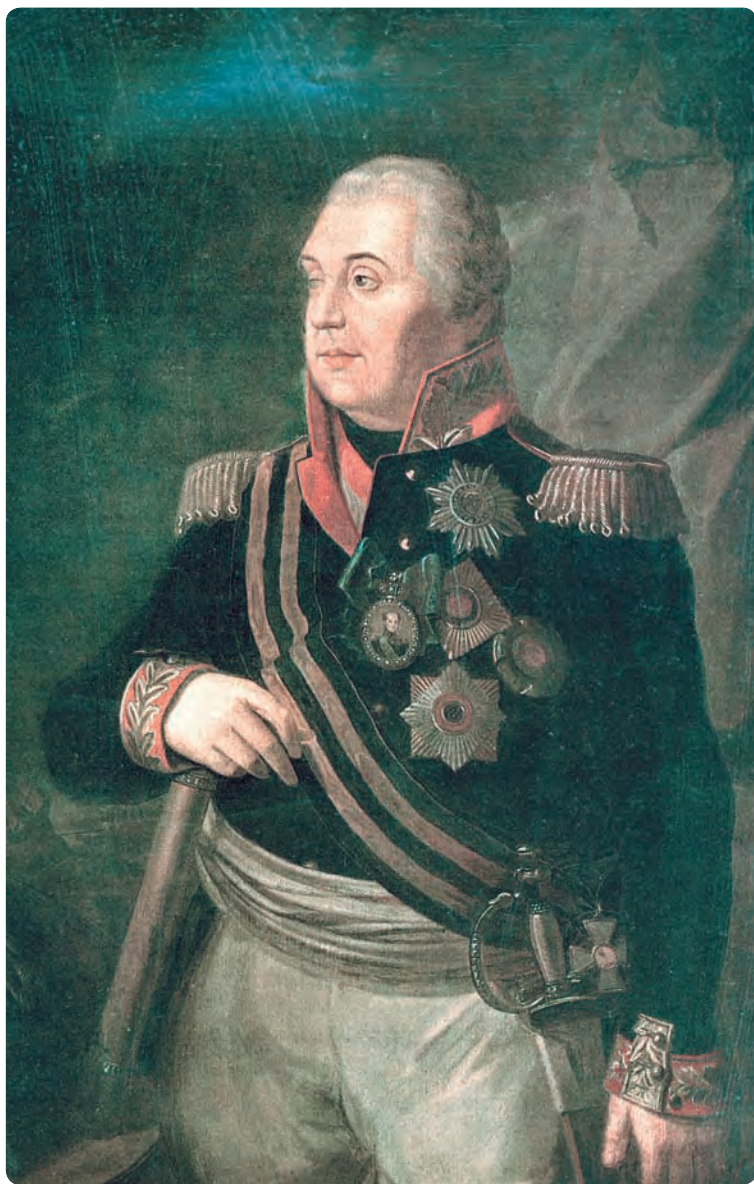
М. И. Голенищев-Кутузов (1745–1813). Художник Р. Волков. 1813 г.