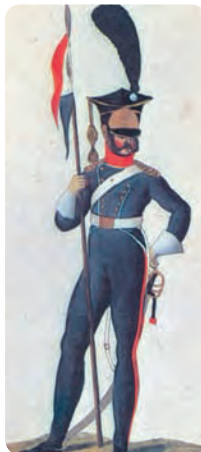
Польский улан. Раскрашенная гравюра Ц. Вейланда. 1812 г.