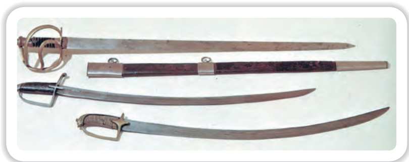
Оружие русской кавалерии: палаш, сабля. Начало XIX в.

главные силы русской армии еще в приграничных районах, а затем двинуть войска на Москву через Смоленск. Захват Москвы, по мнению Наполеона, должен был завершить войну и вынудить Россию к миру.