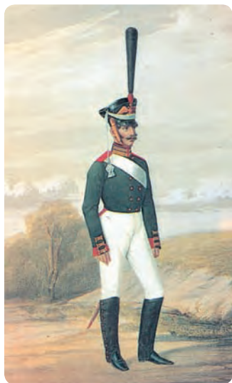
Форма русской армии. Рядовой лейб-гвардии Семеновского полка. Раскрашенная литография Бека по рисунку Губарева. Середина XIX в.

Во второй линии в районе Мозыря сосредоточился резервный корпус Ф.Ф. Эртеля 5 (37,5 тыс. человек). Имелся еще и ре-