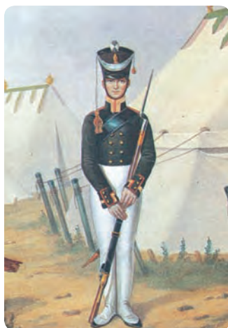
Унтер-офицер егерских полков. Раскрашенная литография Фернлунда 2-го по рисунку Сокольского. Середина XIX в.

были перемолоты в России, и сокрушительный удар по международному престижу Наполеона был нанесен именно в 1812 г. Все последующее явилось, по существу, завершением разгрома наполеоновской империи, осуществленного в 1812 г. народом и армией России.