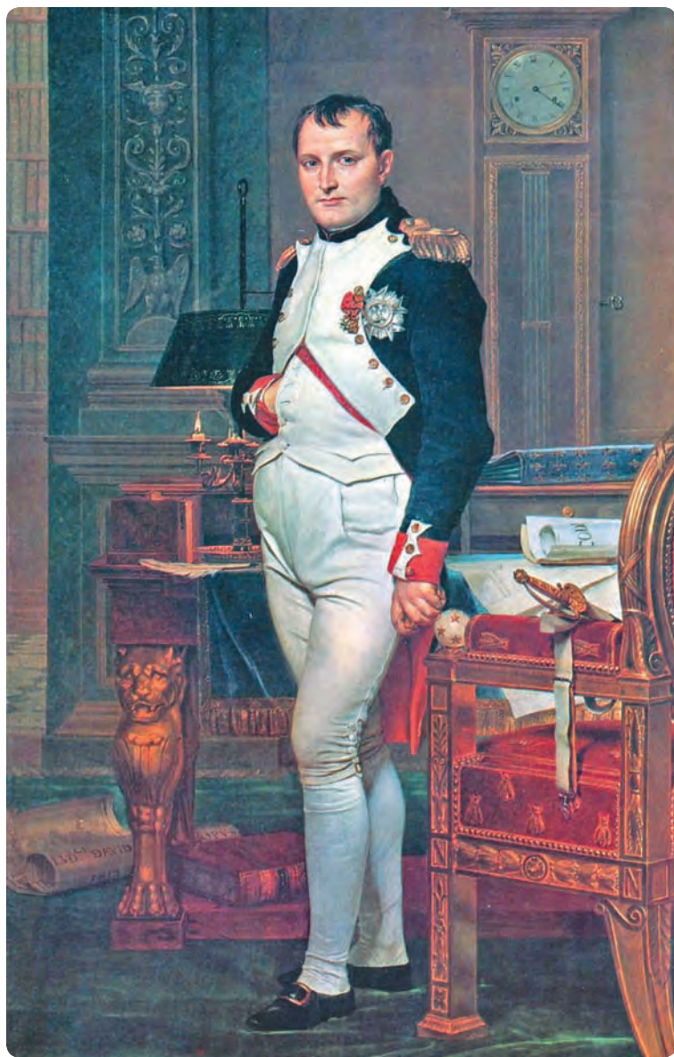
Наполеон в своем кабинете. Художник Ж. Л. Давид. 1812 г.