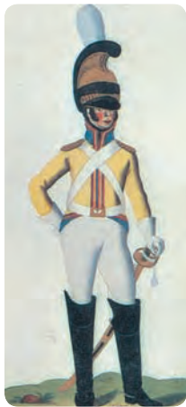
Кирасир гвардейского полка Саксонии. Раскрашенная гравюра Ц. Вейланда. 1812 г.

Наполеон довел этот стратегический метод до предела. Сосредоточивая все или почти все наличные силы в одну массу,