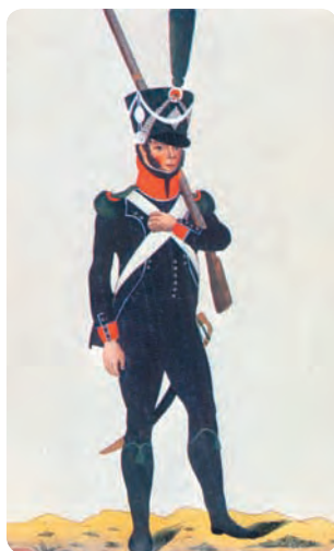
Форма наполеоновской армии. Рядовой легкой пехоты. Раскрашенная гравюра Ц. Вейланда. 1812 г.

На первых двух пунктах обе стороны постепенно наращивали силы за счет ввода в бой резервов. При этом французы в первые часы сражения даже несколько опережали русских во вводе в бой своих сил и поэтому имели численный перевес, временами довольно значительный. Однако это не давало им ощутимого преимущества. Слишком густые и глубокие массы их войск при атаках несли огромные потери от огня русских, которые сами, сражаясь в менее плотных боевых порядках, имели меньшие потери. Истошив противника огнем, русские войска затем отбрасывали его штыковыми контратаками.